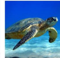
Save the Turtles