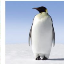
Save the Penguins