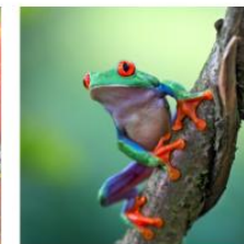
Save the Frogs