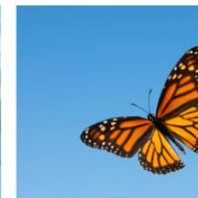
Save the Butterflies