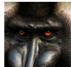
Save the Primates