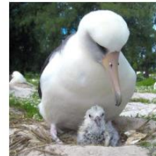
Save the Albatroz