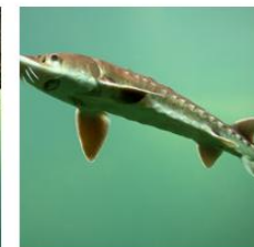
Save the Corals