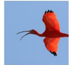
Save the Ibis