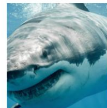
Save the Sharks