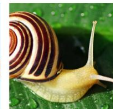
Save the Snails